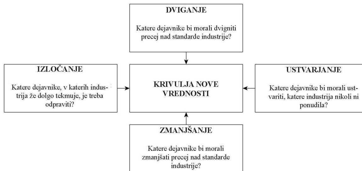
Sl. 2: Okvir štirih ukrepov modrega oceana.

Poleg opredelitve statusa quo podjetja se ta predloga lahko uporabi tudi za ustvarjanje nove krivulje vrednosti inovacije. Okvir štirih ukrepov se lahko uporabi kot podporno orodje za ta namen (glej Sl. 2).